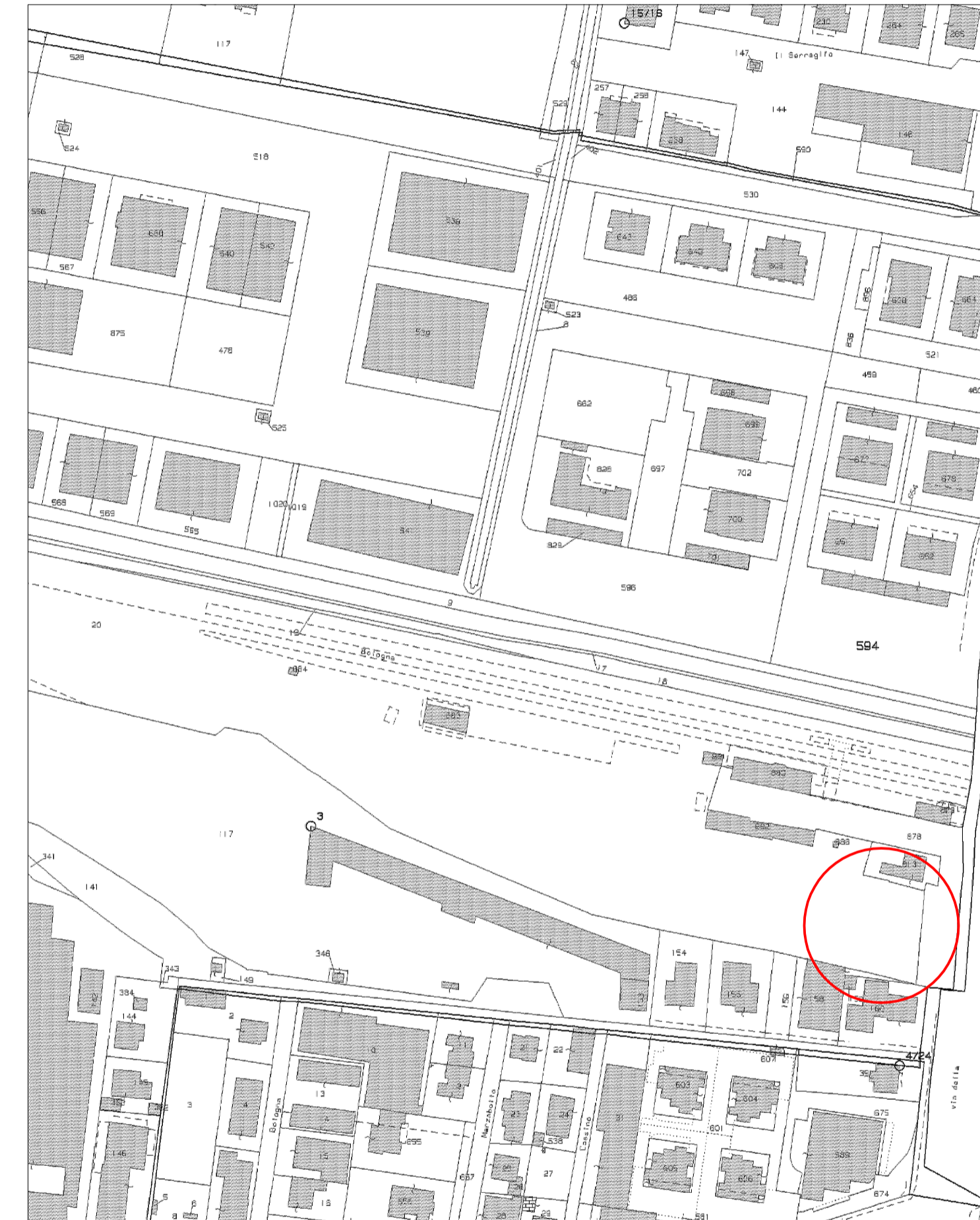
ESTRATTO CATASTALE Fig. 23 - Mapp.le 20 - Sub. 3 Scala 1:2000